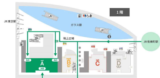
JR有楽町駅からのアクセス

交通 JR線 有楽町駅より徒歩1分 東京駅より徒歩5分(京葉線東京駅とB1地下コンコースにて連絡) 地下鉄 有楽町線:有楽町駅とB1F地下コンコースにて連絡 (ほか)